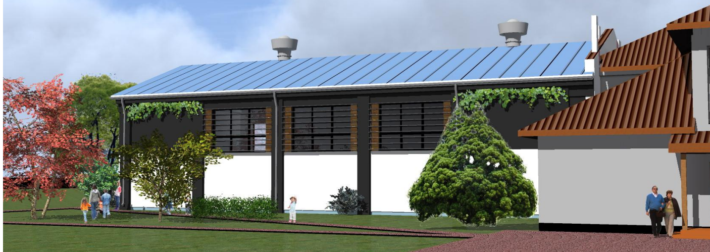
WIDOK OD STRONY PÓŁNOCNO ZACHODNIEJ